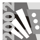
13. Zürcher Kantonales Harmonika Musikfest 9. Juni 2002 Affoltern am Albis

Am 9. Juni 2002 führt das AOBA das Zürcher Kantonale Harmonika-Musikfest in Affoltern a.A. durch. Nach grossen Erfolgen bei Wettspiel-Teilnahmen wechselt das AOBA nun für einmal die Seite und nimmt die Organisation in die Hände. Im Organisationskomitee wirken nebst einem Vertreter des Kantonalen Verbandes alles Mitglieder des AOBA mit.